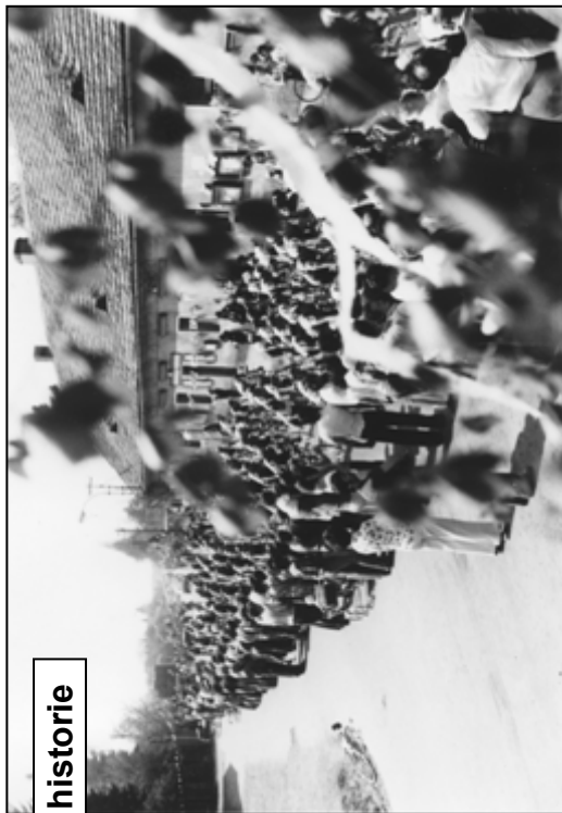
květen 1975 – Průjezd Závodu míru; v pravé části hospoda na Budech (dříve Na posledním penízu)