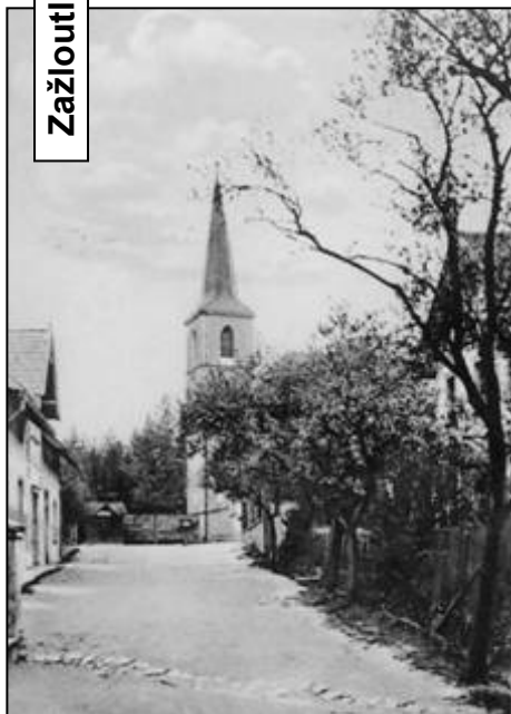
Pohlednice z roku 1928 - cesta ke kostelu podél obecné školy (dnes obecní úřad s poštou)