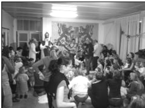
Mikuláš zavítal do mateřského centra v pátek 4. prosince. Než přišel, předvedly děti malé vystoupení, kde se pochlubily, co se v jednotlivých kroužcích od letošního zří naučily.

Pro celé rodiny připravujeme dvě nedělní akce – v neděli 14. února masopustní průvod a o prvním jarním dni 21. března vynešeme Moranu . Více informací najdete na internetu: www.mcmukarovsko.estranky.cz .