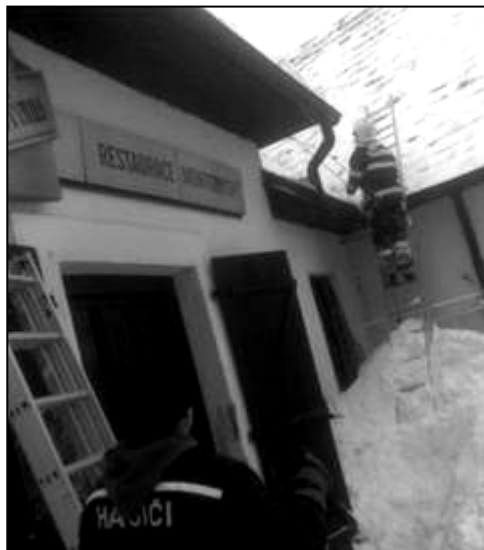
Odklizení sněhu hasiči z přetížené střechy - restaurace Montgomery na Žernovce

SDH Žernovka bude v průběhu roku pořádat mnoho kulturních a společenských akcí nejen pro hasiče, ale hlavně pro místní obyvatele a jejich děti. Těšíme se na shledání na hasičském plese 6. února v restauraci Montgomery.