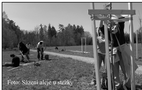
Foto: Sázení aleje u stezky

Zároveň bych chtěl moc poděkovat všem, kteří si adoptovali některý z 46 stromů v aleji při stezce. Více jak polovina adoptivních rodičů nám při sázení stromů také pomohla. Stromy se díky deštivému májovému počasí již krásně zakořenily a zazelenaly. Za pár let se z nich už budou sklízet třešně a hrušky.