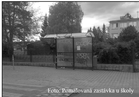
Foto: Pomalovaná zastávka u školy