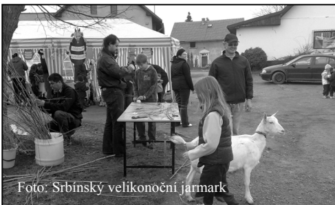
Foto: Srbínský velikonoční jarmark

Změna Srbína na hezké místo k žití, ale nepřijde sama odkudsi shůry. Chceme-li podobně jako vesničané ze Sedmi statečných nakonec zvítězit – tj. udělat ze Srbína hezké místo k žití – musíme se přestat spoléhat na pár „Statečných“. K tomu je zapotřebí změny a přispění nás všech, kteří zde bydlíme.