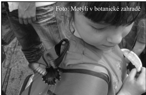
Foto: Motýli v botanické zahradě