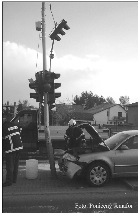
Foto: Poničený semafor

Hned druhý den nastoupila na opravu semaforu firma ELTODO - dodavatel tohoto zařízení a během několika hodin jej zprovoznila. Jak velký byl rozsah poškození si asi každý dovede představit z konečné ceny opravy, která se pohybuje kolem 140.000,- Kč. (rud)