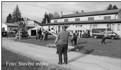
Foto: Stavění májky