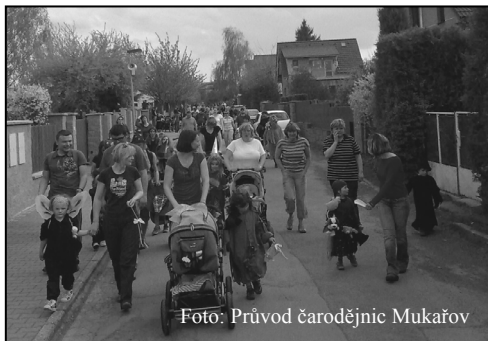
Foto: Průvod čarodějnic Mukařov