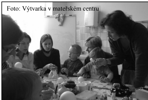
Foto: Výtvarka v mateřském centru

jejichž prostorách má svou hernu a spoluúčivá další místnost pro pohybové aktivity. Recipročně MCM pomohlo s obstaráním vybavení pro družinu (konkrétně zahradních lavic, házeací stěna, ruské kuželky, gymnastické míče a nafukovací branky).